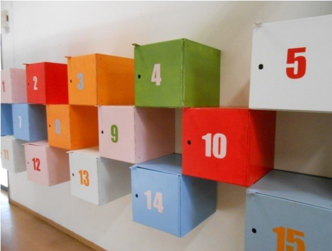
OVI -työpajan säilytyslokerikko (Luokkaretken kuvitusta)